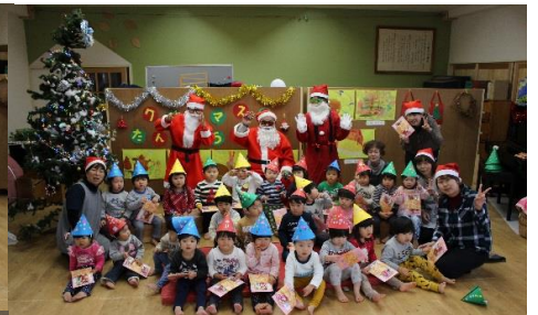
サンタさんがきたよ