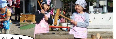
おもちつきしたよ