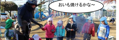
おいも焼けるかな～