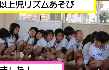
第58回生活発表会 あたたかい応援、ありがとうございました！