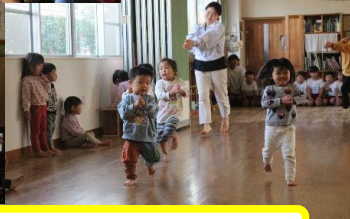
以上児リズムあそび